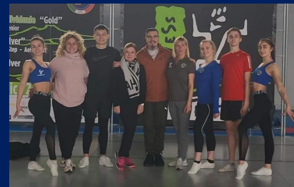
Програма міжнародної академічної мобільності «Master Training Camp International» (м. Екс-ле-Бен, Франція)