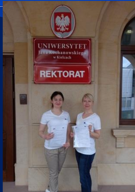
Університет Яна Кохановського у м. Кельце (Польща)