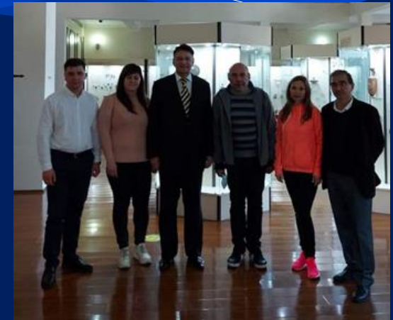
Батумський державний університет імені Шота Руставелі (Грузія)