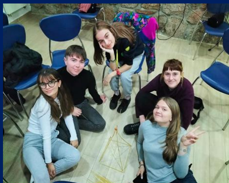
Міжнародна програма молодіжного обміну «Ludopedagogy: Play To Change The World» (м. Мадрид, Іспанія)