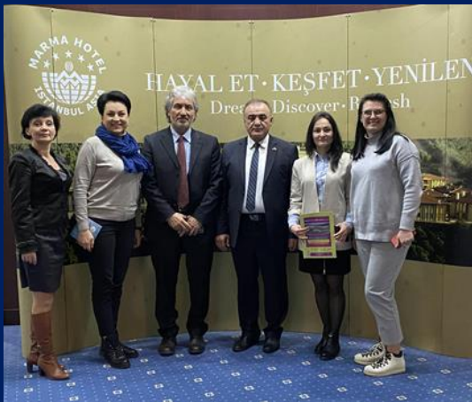
Університет Мальтепе та Стамбульський університет Єні Юзил (Туреччина)