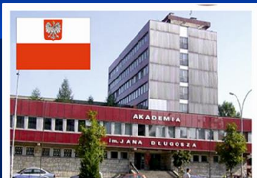
Академія імені Яна Длугоша у м. Ченстохова (Польща)