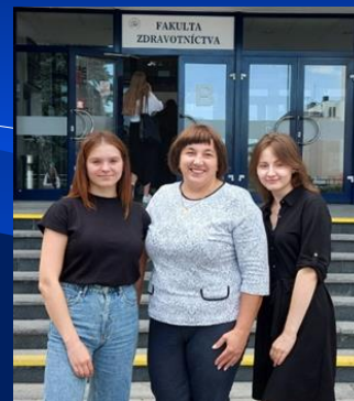
Тренчинський університет Олександра Дубчека (Словаччина)