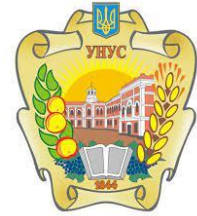
Уманський національний університет садівництва