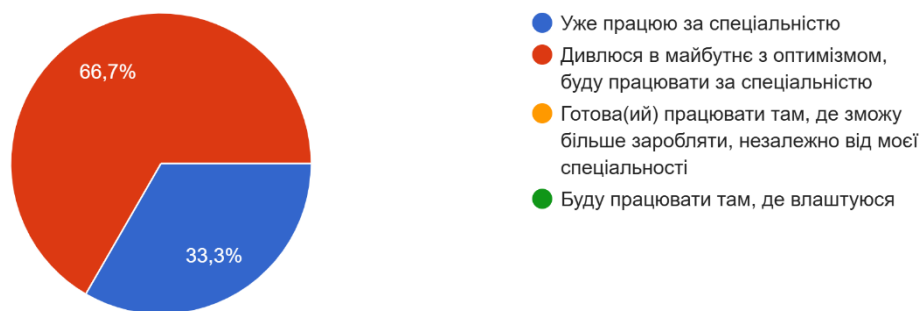
Рис. 1. Розподіл відповідей щодо перспектив на ринку праці

Усі опитані аспіранти (100%) зазначили, що порядок вивчення дисциплін, план та графік освітнього процесу були логічними і послідовними. При цьому на достатньому рівні реалізується в процесі підготовки аспірантів студентоцентризований підхід, що передбачає заохочення здобувачів до ролі автономних і відповідальних суб'єктів освітнього процесу: створення освітнього середовища, орієнтованого на задоволення потреб та інтересів здобувачів, зокрема, надання можливостей для формування індивідуальної освітньої траєкторії; побудову освітнього процесу на засадах взаємної поваги та довіри та партнерства між всіма учасниками освітнього процесу.