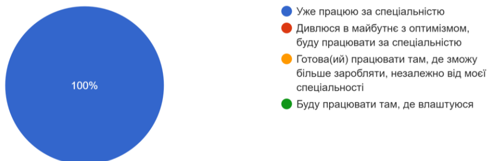
Рис. 2. Розподіл відповідей щодо перспектив на ринку праці

Респонденти амбітно та з позитивом оцінюють свої перспективи на ринку праці, 100% респондентів зазначили, що вже працюють за спеціальністю.