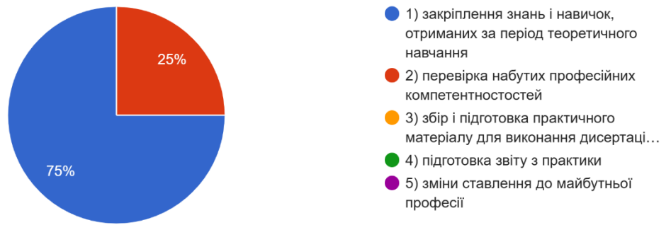
Рис. 1. Розподіл відповідей щодо результату проходження практики

Усі опитані аспіранти вважають достатнім обсяг науково-педагогічної практики, передбаченої освітньо-науковою програмою, при цьому опитані аспіранти вказали на відсутність потреби збільшити кількість годин на практику.